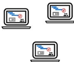
Project Standard Einzelplatz